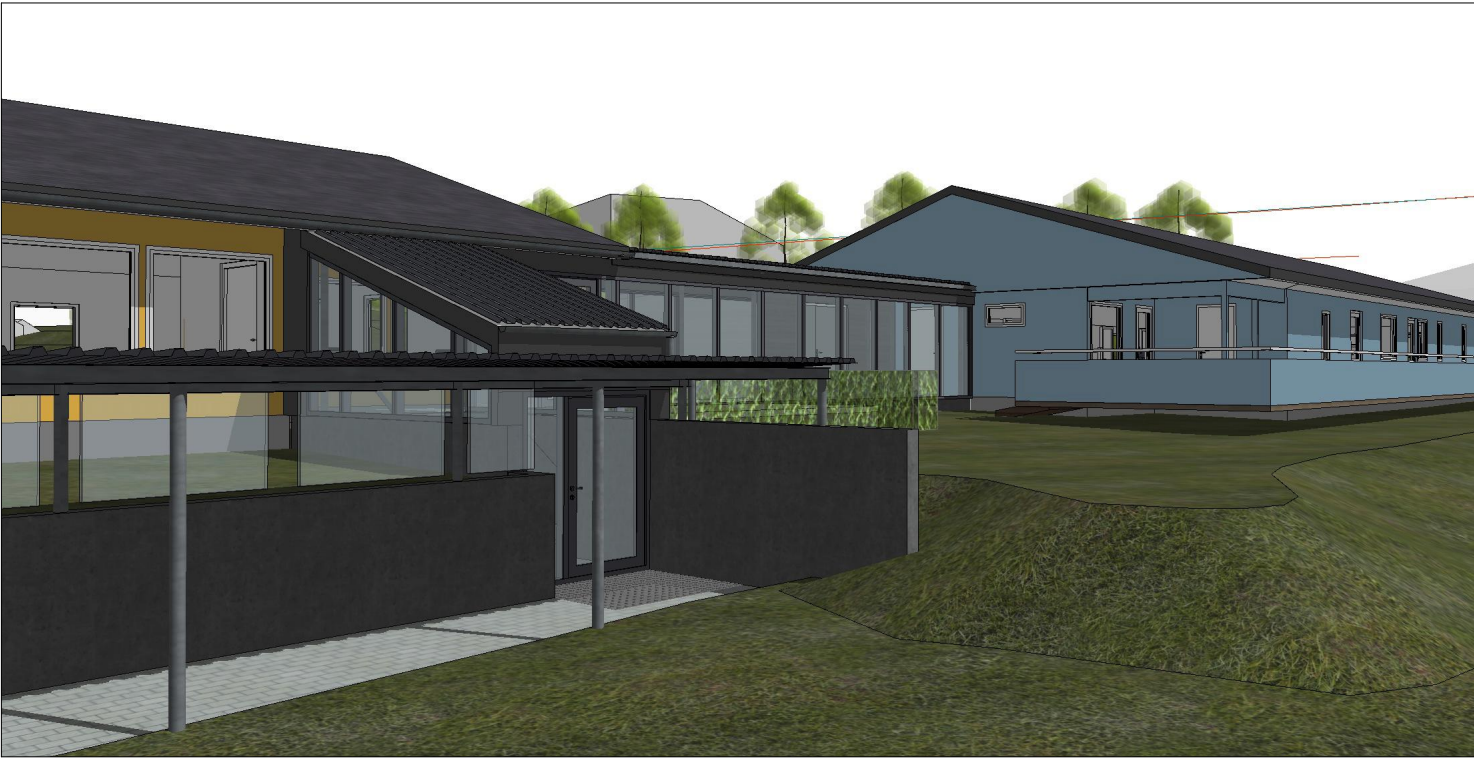
Perspektiv, svalgang_4, klimatisert