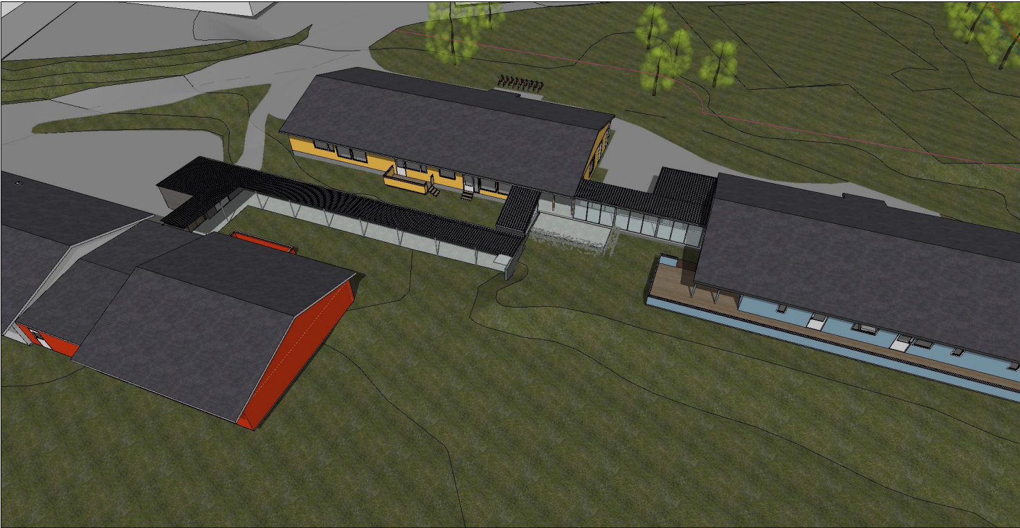
Oversiktperspektiv fra sør