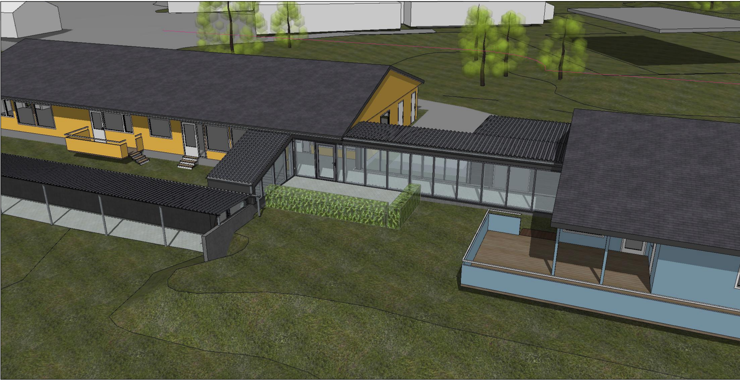
Perspektiv, svalgang_1, klimatisert